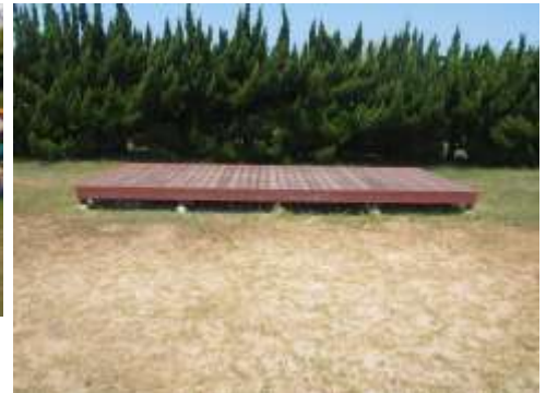
← 幅 7m →